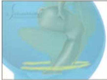
Schematische Darstellung der Beckenbodenmuskulatur

Die verschiedenen Methoden der Vaginalverjüngung sind sehr stark von den physischen Voraussetzungen abhängig. Bei starker Ausweitung, kann es sein, dass eine Unterspritzung alleine nicht ausreichend ist. Ebenso ist der Zustand der Beckenbodenmuskulatur in die Überlegung mit einzubeziehen. Ähnlich wie eine Hängematte trägt dieses Muskelgeflecht die Organe im Unterbauch. Durch Geburten, hormonelle Umstellungen oder Alterseinflüsse kann diese Muskulatur stark ausgeweitet sein. Die Folge ist oft ein eingeschränktes sexuelles Empfinden und/oder Inkontinenz. Zeigt Beckenbodentraining keinen ausreichenden Erfolg, ist eine chirurgische Straffung überlegenswert. Durch eine Korrektur des Beckenbodens kann eine Inkontinenz behandelt werden, die Muskulatur im Beckenboden ist aber auch sexuell von Bedeutung. Bei diesem Eingriff arbeiten wir eng mit erfahrenen Gynäkologen und Urologen zusammen. Welche Art des Eingriffs für Sie richtig ist, kann erst nach einer persönlichen Untersuchung entschieden werden. Alle Operationen der Vaginalverengung sind miteinander kombinierbar.